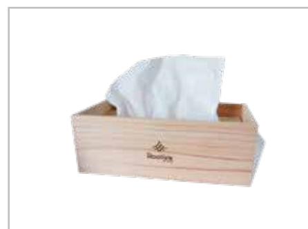
ティッシュケース