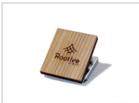
マグネットクリップ