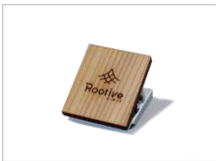
マグネットクリップ