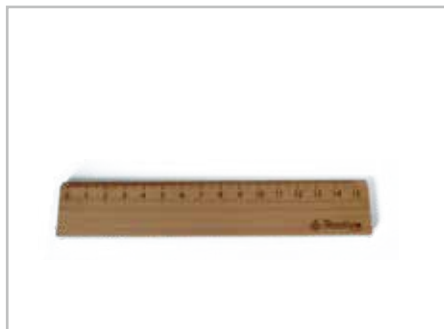
ものさし ノベルティなど