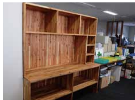
作業台兼パーテーション