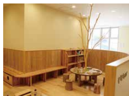
シンボルツリー付テーブル 丸太椅子