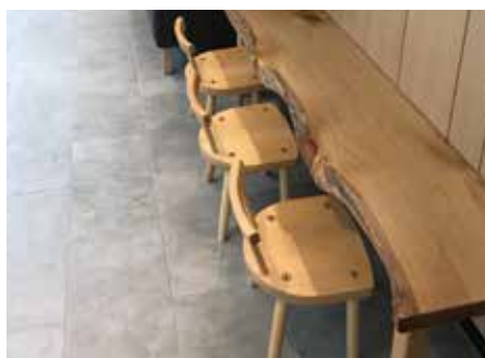
子供用椅子、テーブル